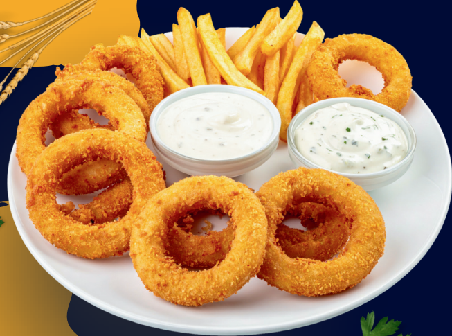
Fritas com Cheddar e Bacon