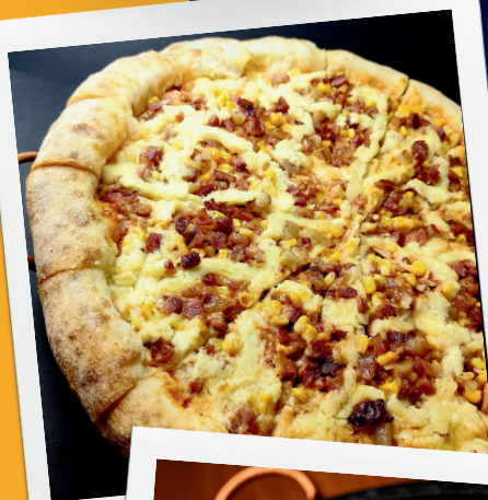
Bacon com Milho