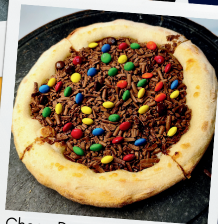
Choco Duo e Uva