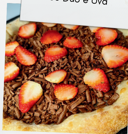
Chocolate com morango