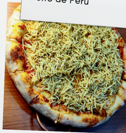
Estrogonofe de Filé