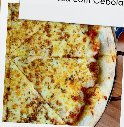
Alho e Óleo